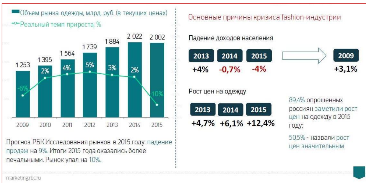
Рис. 1. Состояние отечественного ритейла одежды

Статистика показывает, что в разных российских городах цены на одежду, в среднем, повысились за 2015 год на 23%. Данные Росстата указывают на то, что доходы жителей нашей страны с октября прошлого года снизились на 5,5%, и успели сравняться с аналогичным периодом 2014 года. Зарплата россиян при этом упала почти на 11%. Именно поэтому многие стали ограничивать себя в приобретении некоторых категорий товаров не первой необходимости, включая и одежду. Только 1,5% жителей России ответили, что не почувствовали кризис и ни в чем себя не ограничивают.