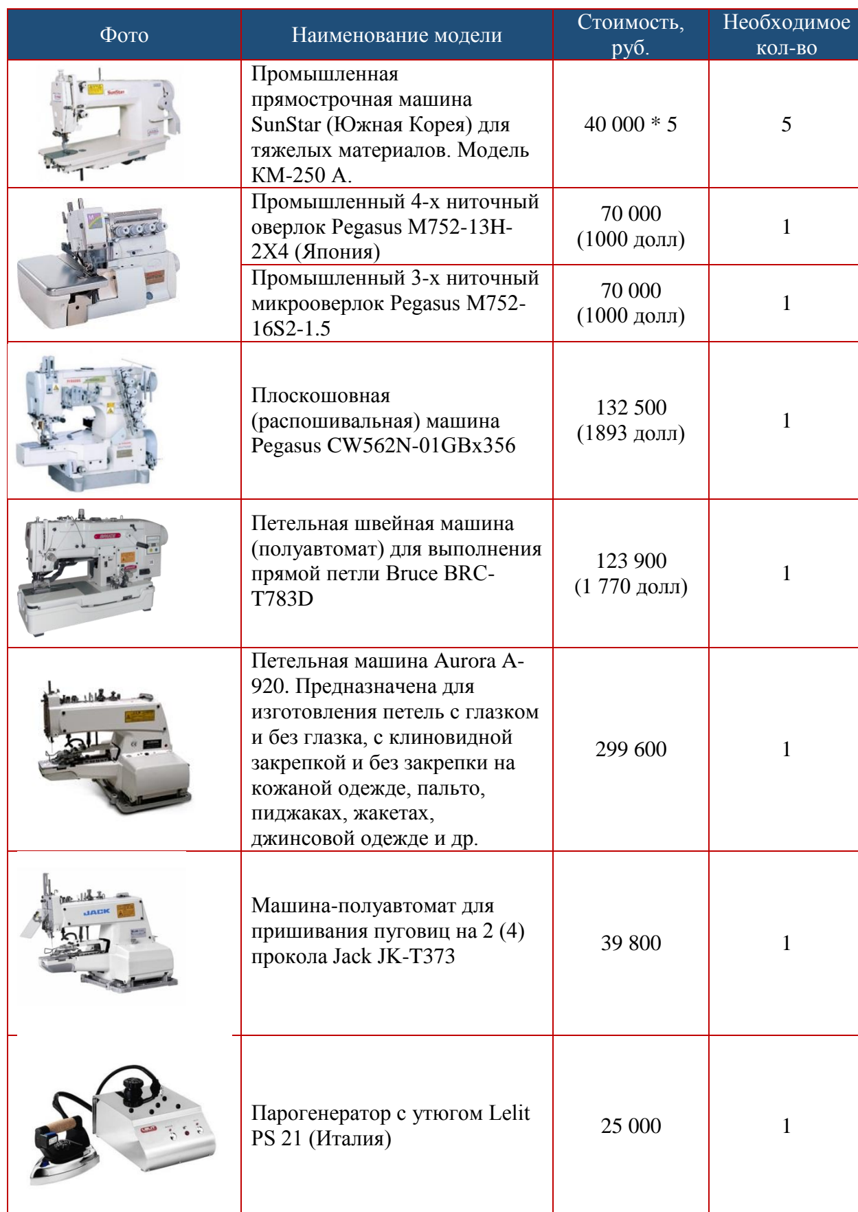
Таблица 1. Перечень приобретаемого технологического оборудования

В целях реализации проекта предполагается приобретение следующего оборудования и мебели: