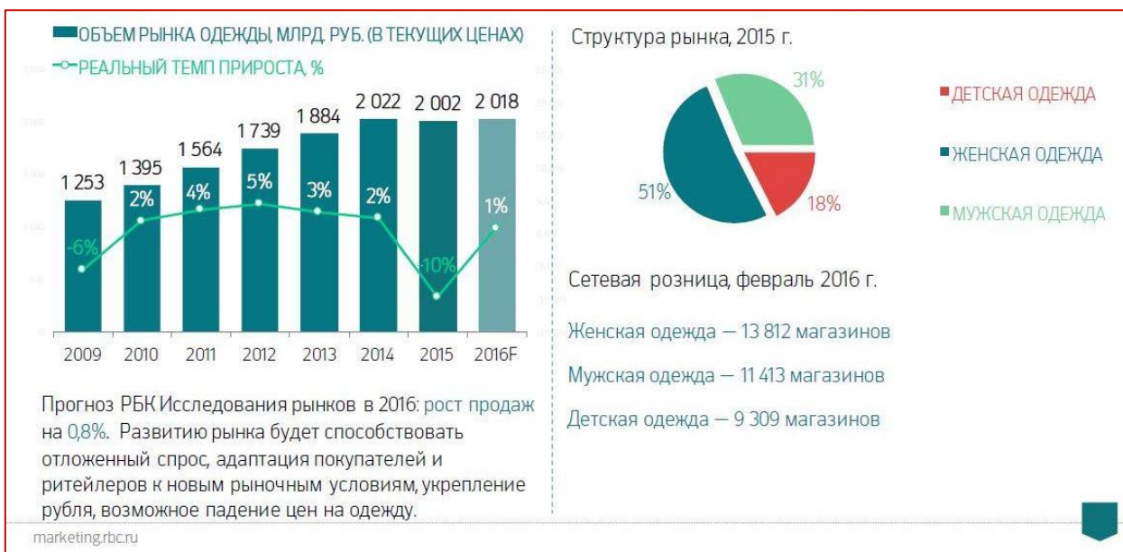
Рис.2. Прогноз развития рынка ритейла одежды

По прогнозам специалистов РБК, 2016 год в России может стать переломным для отрасли – аналитики прогнозируют рост рынка одежды на 0,8% и стабилизацию в обувном ритейле. Наибольший рост ожидается в сегментах женской, детской и подростковой одежды и обуви, наименьший – в мужском сегменте.